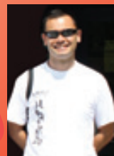
Luca Chiappini allenatore di serie A femminile